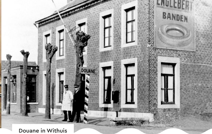
Douane in Withuis