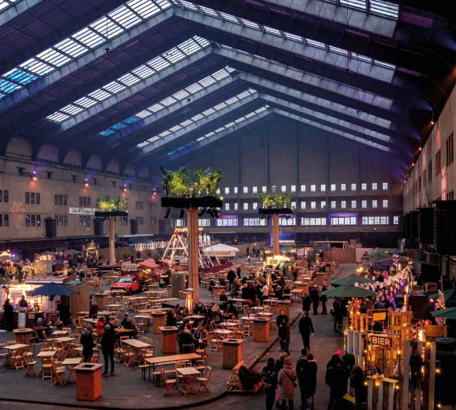
De komende jaren restaureert BOEi de enorme monumentale Centrale Markthal in Amsterdam tot publiekstrekker voor voedselminnend Nederland.