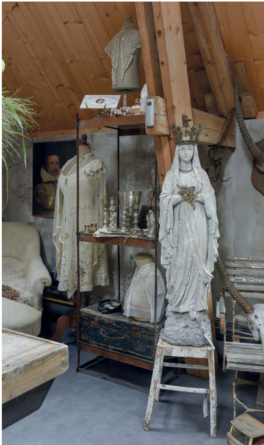
'Het voormalige magazijn van deze graansilo dateert uit de jaren 20'