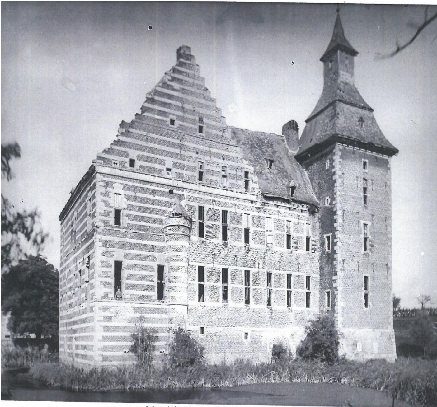
Eind negentiende eeuw fotografeert Rijksarchitect voor de Monumenten Adolph Mulder Kasteel Schaesberg. Zijn vrouw poseert links in het raam