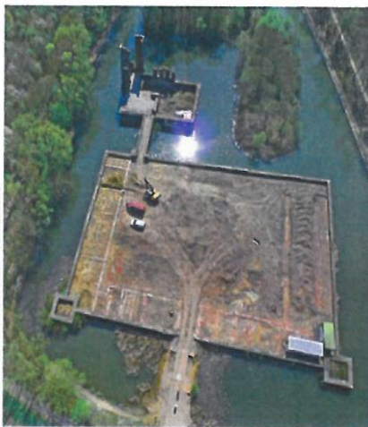
De restanten van het kasteel en de hoeve in 2013

De familie Schaesberg bleef wel nog tot 1944 eigenaar van het kasteel. In dat jaar is Schaesberg