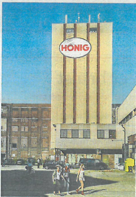
Erfgoed De voormalige Honig-fabriek in Nijmegen is een roerbakmix geworden van horeca, stadssporten en kinderplezier (links).

Tekst: Matthijs Meeuwse