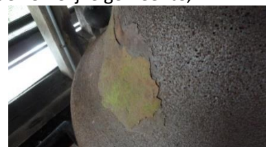
de klok van gegoten staal nu aangevreten door de tand des tijds

Deze klok is een van gegoten staal, toentertijd een nieuwigheid, die niet werkelijk ingang heeft gevonden, maar waaraan de kerk te Oudorp wel te danken heeft, dat de klok in de tweede wereldoorlog niet door de Duitsers werd weggehaald.