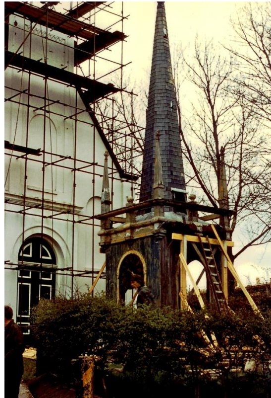
de toren voor de kerk bij de vorige restauratie van de toren

Na de annexatie van Oudorp door Alkmaar werden de uurwerken en klokken onder het regime van de gemeente Alkmaar geplaatst vanuit de gedachte dat de toren van de kerk aan de burgerlijke gemeente toebehoorde. Gelet op de geschiedenis van de "Gesloopte toren van Oudorp" en het vervolg blijkt dat een niet juiste gedachte te zijn.