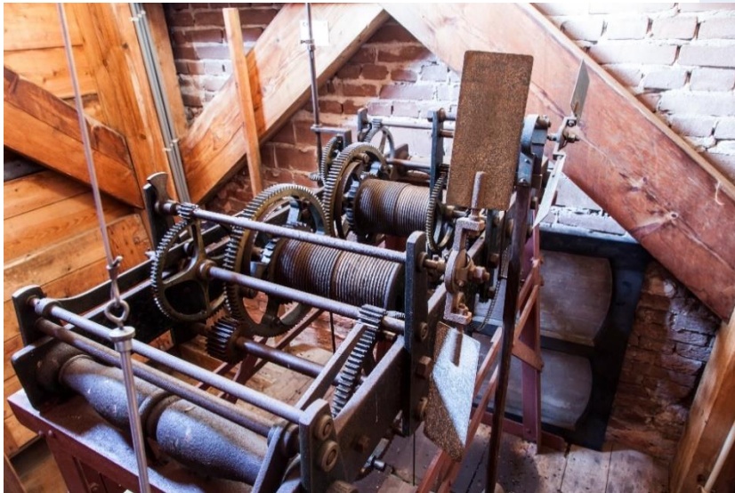
De aandrijving van weleer voor de tijdsaanduiding

Op het kleine kerkje op de terp aan het einde van de strandwal staat een torentje op een onderbouw ter grote van een forse kist waarin een aantal van jaloezieën voorziene gaten. De galmgaten. In de klim naar achter die galmgaten komen we op een plateautje waar we een machine aantreffen. Het blijkt de aandrijving van de tijdsaanduiding te zijn. Het oude uurwerk dus.