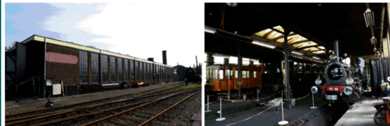
Industrielloods te Hoorn

De loods zal ook in de toekomst dienst blijven doen als remise voor de Stichting Stoomtram Hoorn-Medemblik maar daarvoor is een forse investering nodig; deels om te voldoen aan moderne regelgeving op het gebied van bodemsanering en arbeidsomstandigheden (zodat de vele vrijwilligers veilig hun werk kunnen doen).