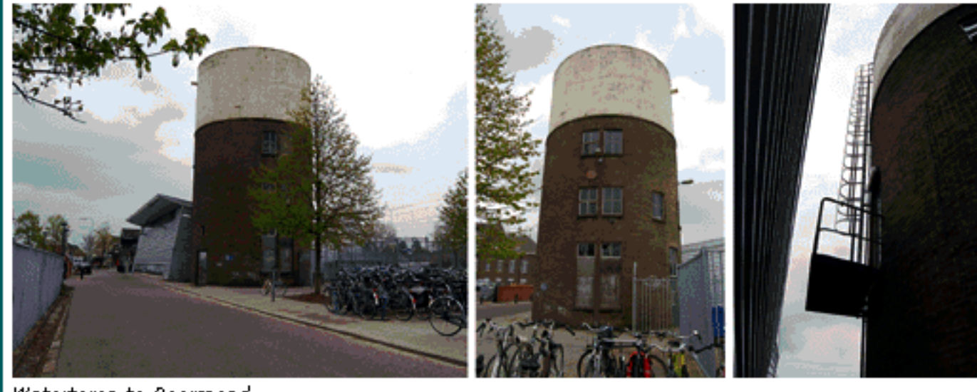
Watertoren te Roermond

De panden in Haarlem zijn de Smederij (1907) en het Seinwezen (1914) en hebben tot 2000 dienst gedaan als smederij en werkplaats voor het Seinwezen. Dat Seinwezen was een onderafdeling van de dienst Weg en Werken, die het onderhoud verzorgde aan en op de spoorbaan, waaronder de wissels, seinen, overwegen, etc. De Smederij is nu in gebruik als woonhuis en het Seinwezen is voor een groot deel ingericht als kantoorruimte, de rest wordt af en toe gebruikt voor partijen en recepties. In het gebouw is onder meer Bureau Alle Hosper voor landschapsarchitectuur en stedenbouw ( www.hosper.nl ) gevestigd. Het Seinwezen zal verder gerestaureerd worden en in zijn geheel geschikt gemaakt worden voor verhuur als kantoor.