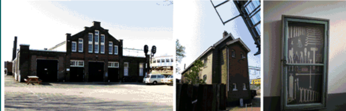
Smederij en Seinwezen te Haarlem

De panden in Haarlem zijn de Smederij (1907) en het Seinwezen (1914) en hebben tot 2000 dienst gedaan als smederij en werkplaats voor het Seinwezen. Dat Seinwezen was een onderafdeling van de dienst Weg en Werken, die het onderhoud verzorgde aan en op de spoorbaan, waaronder de wissels, seinen, overwegen, etc. De Smederij is nu in gebruik als woonhuis en het Seinwezen is voor een groot deel ingericht als kantoorruimte, de rest wordt af en toe gebruikt voor partijen en recepties. In het gebouw is onder meer Bureau Alle Hosper voor landschapsarchitectuur en stedenbouw ( www.hosper.nl ) gevestigd. Het Seinwezen zal verder gerestaureerd worden en in zijn geheel geschikt gemaakt worden voor verhuur als kantoor.