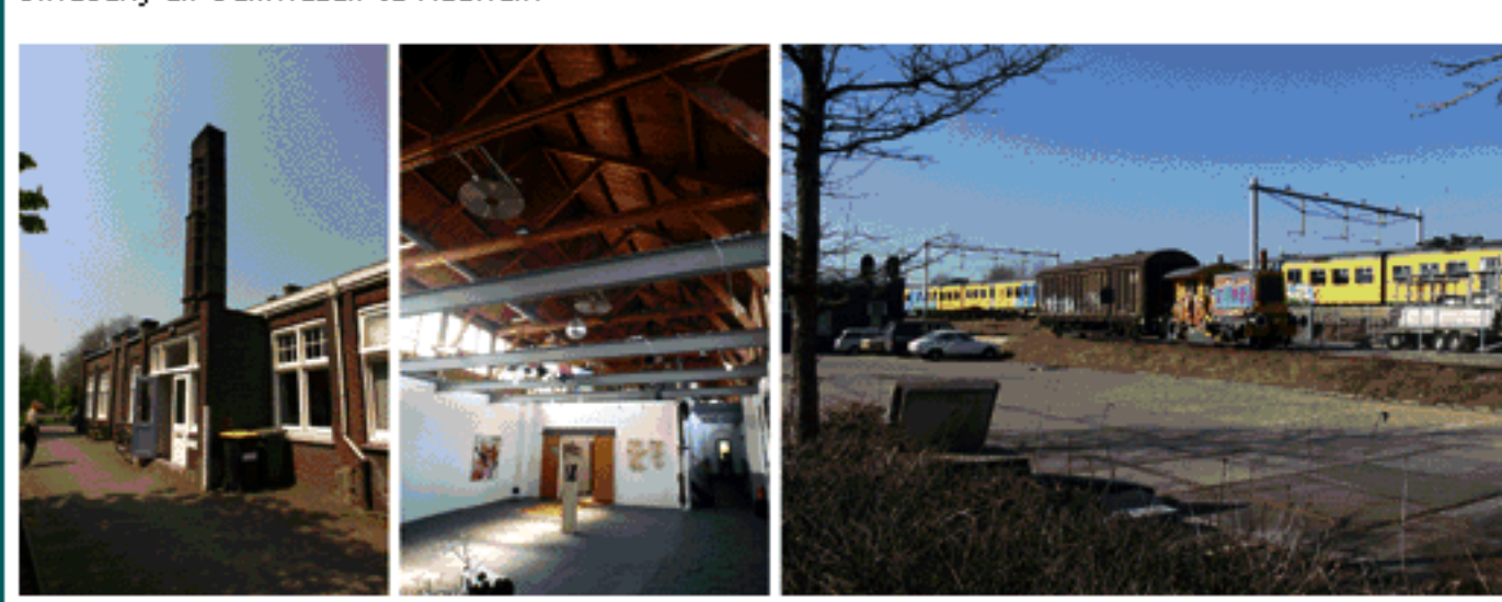
Smederij en Seinwezen te Haarlem