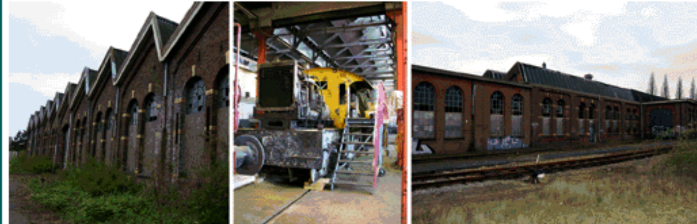
Wagenmakerij te Venlo-Blerick

BOEi heeft 2007 mooi af kunnen sluiten. Op de allerlaatste dag van jaar is de levering bij de notaris van vijf panden van NS Poort definitief gepasseerd. Het betreft de werkplaats en loods van de Wagenmakerij in Venlo-Blerick (zie ook onze nieuwsbrief van oktober 2007), de watertoren uit 1925 bij het station van Roermond (van architect Sybold van Ravesteyn die onder andere ook Diergaarde Blijdorp te Rotterdam en station Rotterdam Centraal heeft ontworpen) en gebouwen in Haarlem en Hoorn.