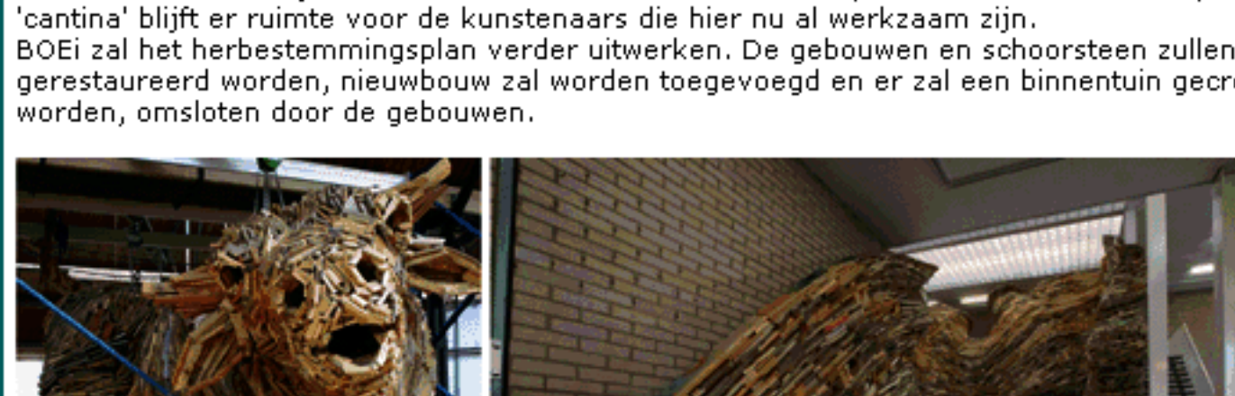
'De Stier' door Thijs Trompert

BOEi zal het herbestemmingsplan verder uitwerken. De gebouwen en schoorsteen zullen gerestaureerd worden, nieuwbouw zal worden toegevoegd en er zal een binnentuin gecreëerd worden, omsloten door de gebouwen.